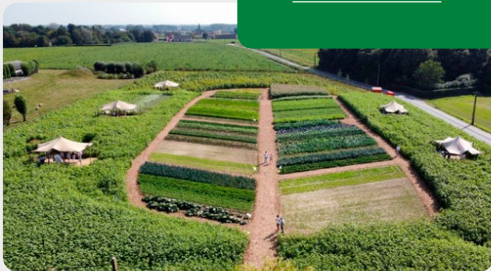
Evento "Let's Meet in the Field event" en septiembre de 2023

También queremos combatir el cambio climático con el programa MIMOSA+ , que tiene como objetivo restaurar la salud del suelo e implementar prácticas agrícolas regenerativas . Estos esfuerzos, presentados