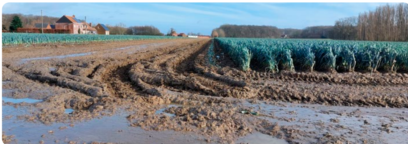
Campo de puerros inundado cerca de nuestra fábrica de Ardoois, Bélgica