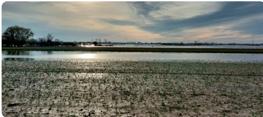
Campos totalmente inundados en Flandes Occidental, Bélgica

Las buenas noticias nos llegan de nuestras plantaciones de hierbas, donde el cultivo de la mayoría de las especies anuales ha resultado un éxito. La selección de nuevas variedades resistentes y la implementación de nuevas técnicas de cultivo parecen dar frutos y ser prometedoras de cara a las próximas temporadas.